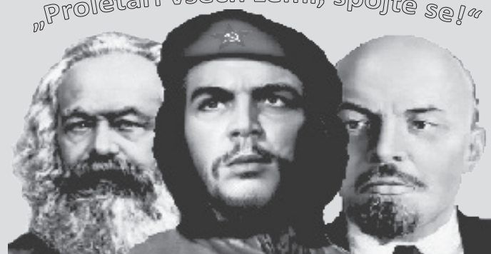
Marxisticko-Leninský Odborný Klub